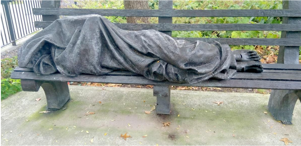
(Obdachloser Jesus vor St. John the Devine, NYC)

Gut, dass Kirche sich berühren und herausfordern lässt von Not und Unrecht - unser Glaube hat Herz, Hand und Fuß.