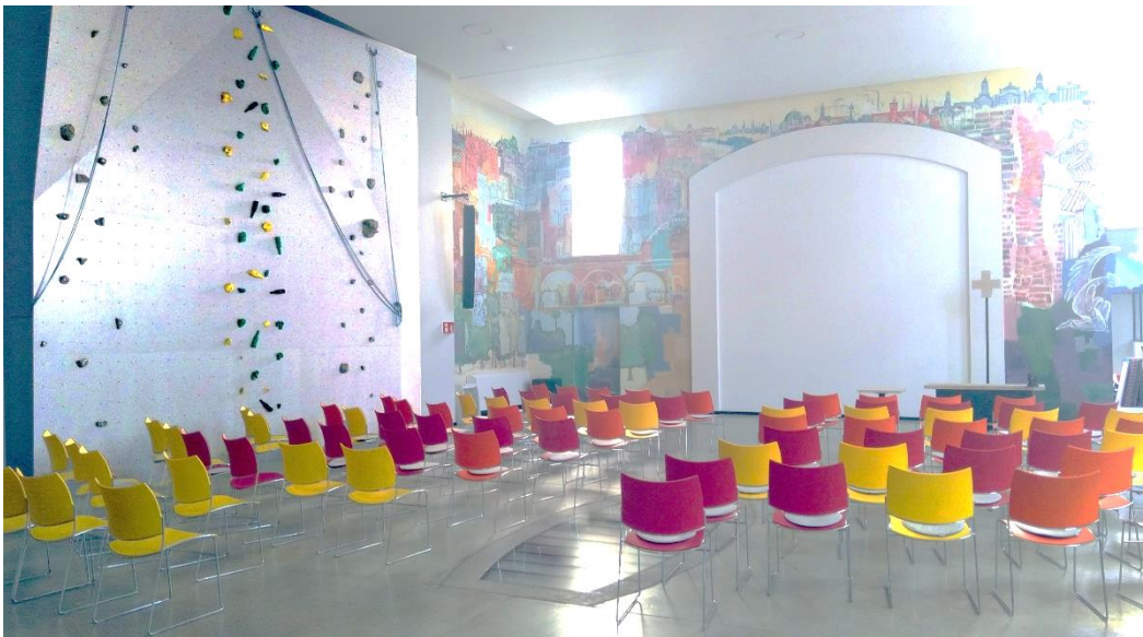
(Kirchraum mit Kletterwand in Berlin Wedding)

Vor-Bilder bringen uns auf Ideen, - Räume neu zu gestalten und anders zu nutzen.